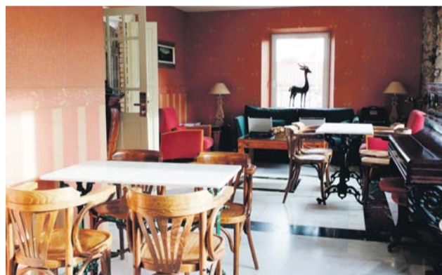
Las estancias cuentan con todo lujo de servicios.

totalmente restauradas, en las que se combinan tradición y diseño permitiendo crear así un clima acogedor y sugerente.